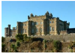
CASTELLO DI CULZEAN

La nona edizione di “English runs in Europe” si svolgerà presso la Saint Andrews University (nei pressi di Edimburgo), la più antica ed importante università scozzese, tra le più note e prestigiose di tutto il Regno Unito (nota anche perché vi ha condotto gli studi universitari il principe William e la consorte Kate), ove si terranno corsi intensivi di lingua inglese, nell'arco di due settimane (dal 21 luglio 2013 al 4 agosto 2013).