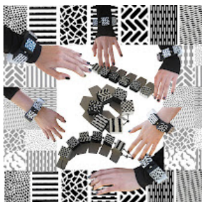
My Laminate Bracelet , Pubblicato da Chiara Fugazzotto a 4/23/2012 12:36:00 AM 8 punti post