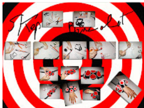
6 SKEP Bracelet , Pubblicato da Maria Lorenza Crupi a 4/23/2012 04:21:00 PM 10 post