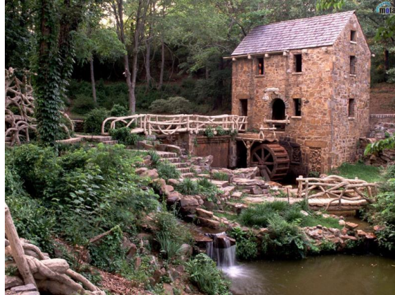
Figura 3 | Un antico mulino ad acqua