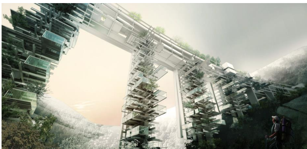
Figura 5 | Progetto vincitore del Concorso Parco Solare Sud – L'Autostrada Solare, Studi PR e OFF

Sempre nel senso del recupero è stato il Concorso di idee Parco Solare Sud – L'Autostrada Solare che qualche anno addietro riguardò l'ipotesi di dare un nuovo senso al tratto dell'Autostrada del Sole all'altezza di Scilla. Invece di demolirla con elevatissimi costi stimati in ca. 40 mil. di euro si proponeva di trasformarla in un'asse a servizio del territorio circostante. Così non solo risparmiando un grossa cifra ma anche salvaguardando un magnifico manufatto costituito dal cavalcavia esistente. Potendo divenire un esempio di riqualificazione territoriale basata sul riuso, il riciclaggio, di un'infrastruttura che disegna il paesaggio moderno dell'Italia. Interessante era anche il forte legame all'energia, puntando ad una integrazione tra il recupero e la nuova funzione di asse privilegiato per la produzione di energia di vario genere, dal solare al minieolico. Accompagnata alla riscoperta delle risorse naturali esistenti a fini anche di produzione agricola ed alimentare. Grazie ad un ripensamento dei collegamenti locali l'accessibilità alle aree circostanti avrebbe consentito connessioni praticabili anche di tipo ciclabili e pedonali (Fig. 5).