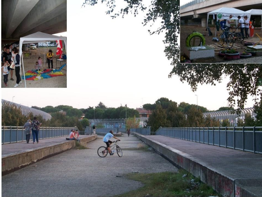
Figura 1 | Ponte dei Presidenti, Municipio III, Roma; situazione attuale di disuso ed evento TUTUR