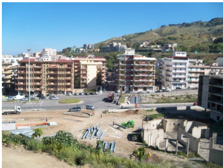
Figura 7 | Riuso a parcheggio dell'area dinnanzi il rudere della Casa dello Studente, accanto la fiamara