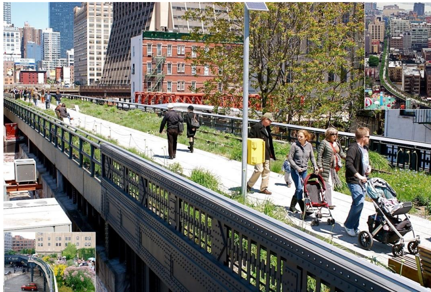
Figura 2 | High Way, New York, attuale riuso come strada verde urbana

Altro grande tema emergente nella proposizione di nuovi, o forse del recupero, di paesaggi territoriali e di centri grandi, medi o piccoli è il recupero dell'acqua e dei tanti mulini, canali urbani, vie d'acqua. Nuovamente emerge l'importanza della scala dimensionale. Mentre a Milano si ripensano i Navigli ed una loro riscoperta per un paesaggio urbano i mulini ad acqua intorno ai quali sorsero piccoli e piccolissimi centri. Elementi però divenuti talmente rilevanti che la UE ha dedicato al loro recupero ( http://www.restor-hydro.eu/en/about-restor-hydro ) (Figura 3)