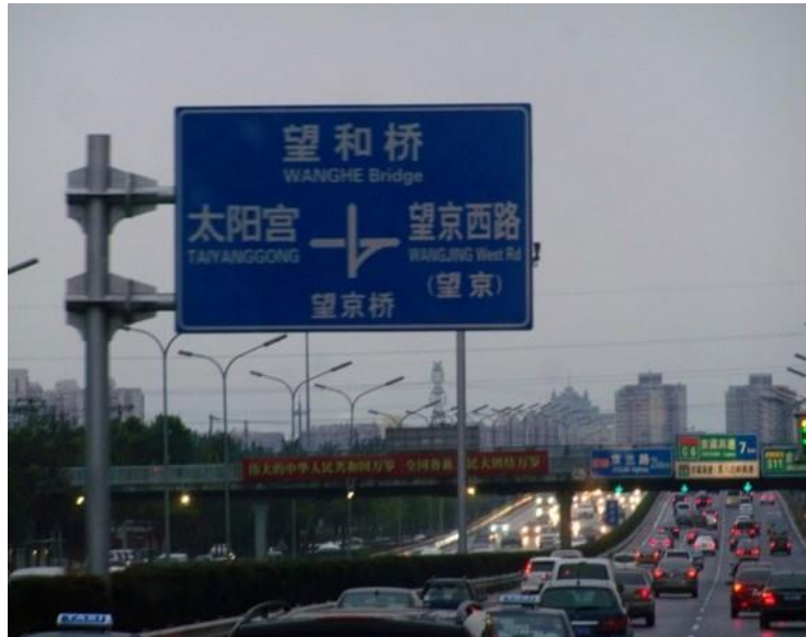
Figura 6 | Pechino traffico urbano, palazzi e piccola pagoda