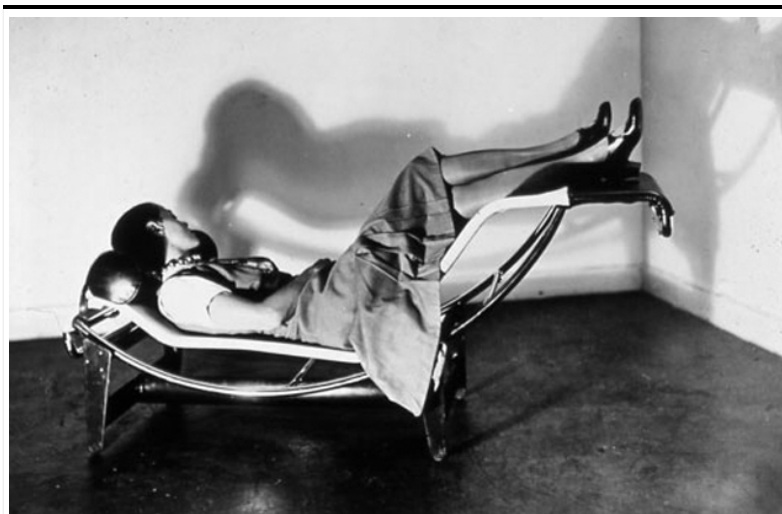
Charlotte Perriand sur la Chaise Longue Basculante, Le Corbusier, Jeanneret, Perriand, 1928

scaricabile da: http://www.architettura.unina2.it/docenti/aresprivata/65/documenti/LE%20CABANON.pdf