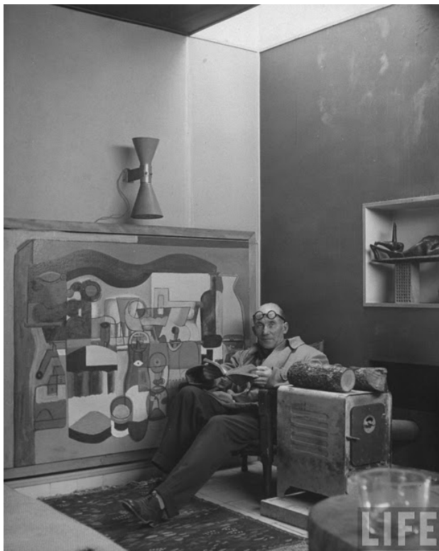
Le Corbusier - foto Nina Leen, 1946 - LIFE