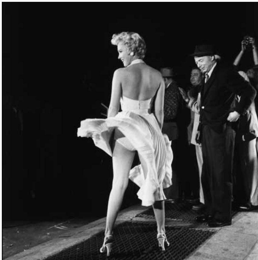
The Seven Year Itch (Quando la moglie è in vacanza), 1955, regia di Billy Wilder