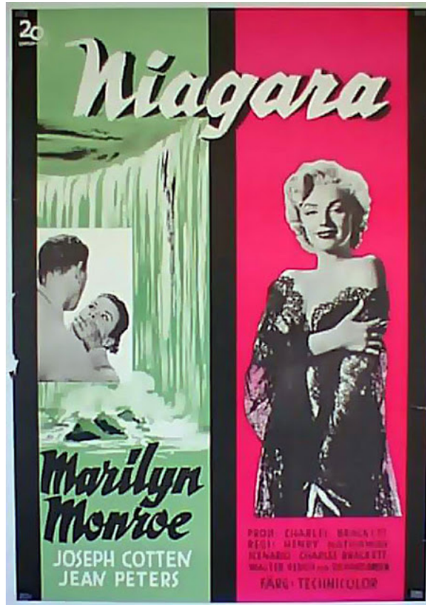
Niagara, 1953, regia di Henry Hathaway