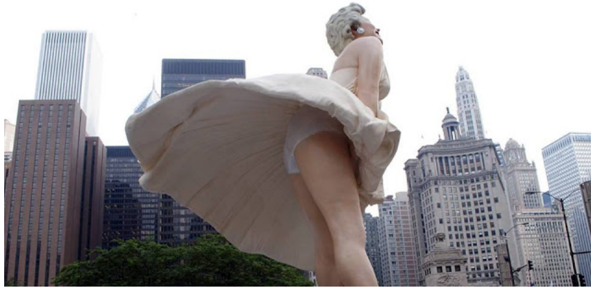
John Seward Johnson II, FOREVER MARILYN megascultura itinerante,

Pioneer Court, 401 North Michigan Ave, CHICAGO, ILLINOIS - IL 60611-4255.