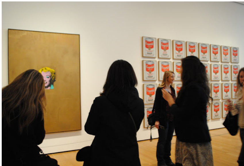
Andy Warhol, Gold Marilyn Monroe , 1962 - © foto cecilia polidori, MOMA, NYC, 16 Marzo, 2011