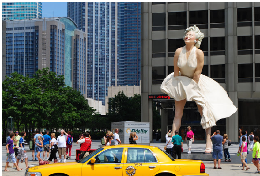
John Seward Johnson II, FOREVER MARILYN megascultura itinerante, Pioneer Court, 401 North Michigan Ave, CHICAGO, ILLINOIS - IL 60611-4255.