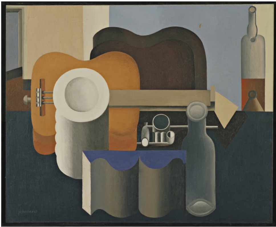
Le Corbusier (Charles-Édouard Jeanneret) (6 ottobre 1887, La Chaux-de-Fonds, Svizzera - 27 agosto 1965, Roquebrune-Cap-Martin, Francia) Still Life/ Natura morta con pila di piatti, olio su tela/ oil on canvas, 1920, MOMA Museum NYC (Museum of Modern Art, New York), 80.9 x 99.7 cm.

Cecilia Polidori - Sixties Design in the World: Metal, Plastic, Fashion, Music, Cinema and TV - LEZIONI - PIATTAFORME DIDATTICHE