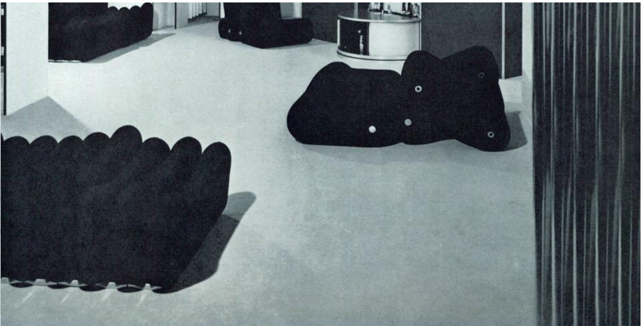
↑ Veduta del mobile contenitore: bar, radio, televisione. Dal soffitto arrivano i cavi di alimentazione a vista

Editoriale Domus Spa Via G. Mazzocchi, 1/3 20089 Rozzano (MI) - Codice fiscale, partita IVA e iscrizione al Registro delle Imprese di Milano n. 0783550158 R.E.A. di Milano n. 1186124 Capitale sociale versato € 5.000.000,00 - All rights reserved - Informativa cookie completa - CONTATTI