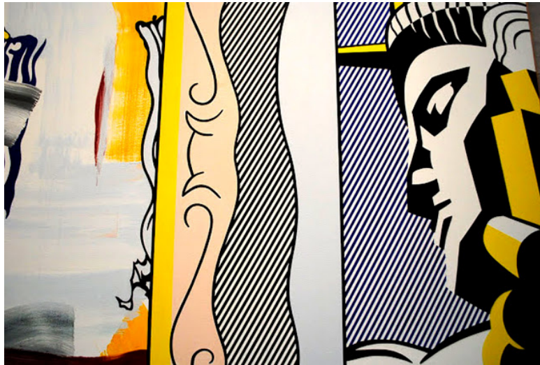
© foto cecilia polidori - da: CECILIA POLIDORI USA 2010 - http://ceciliapolidoriusa2010.blogspot.it/ / ROY LICHTENSTEIN, NATIONAL GALLERY OF ART EAST, WASHINGTON D.C.