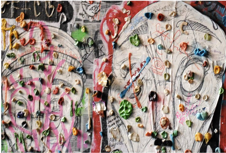
Seattle - Gum Wall - 1428 Post Alley: "memoria" e fantasia stratificata dei passanti. fotoreportage Seattle USA 2012