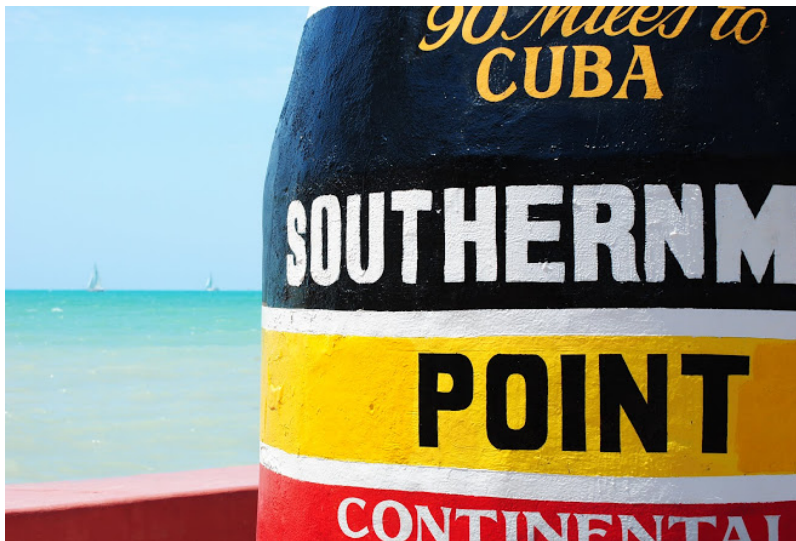
Southernmost Point, South Street, Key West, Florida, aprile 2013