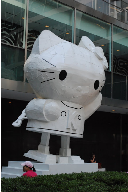
DESIGN - http://ceciliapolidori.blogspot.it/?zx=a28966a9b9e21215 -