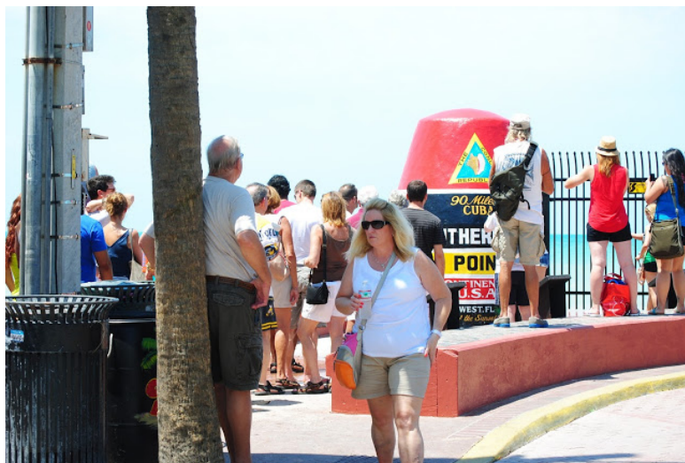
Southernmost Point, South Street, Key West, Florida, aprile 2013