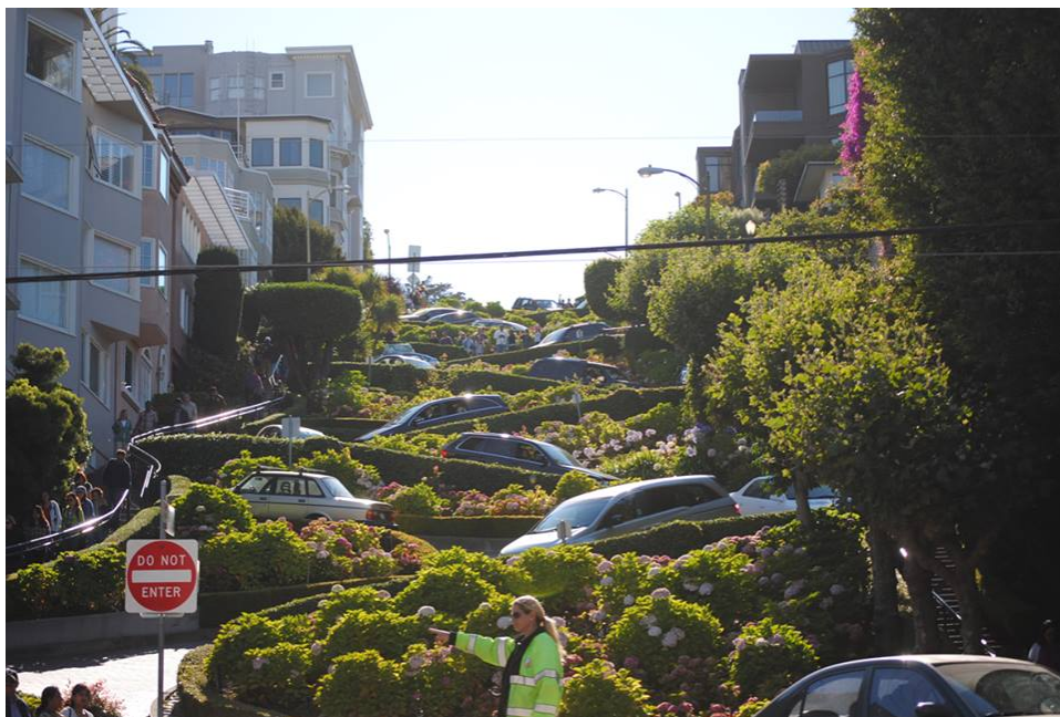
Lombard street, San Francisco, agosto 2012: "un set cinematografico cittadino famosissimo da percorrere in macchina..."