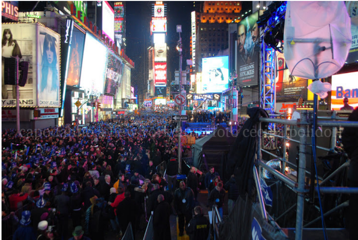
Capodanno 2012 a Time Square, New York C.

da: cecilia polidori design USA 2011: Saint Patrick's Day, festa del patrono irlandese, 17 marzo, immagine scattata alla parata a New York http://ceciliapolidoriusa2011.blogspot.it/2014/07/saint-patricks-day-festa-del-patrono.html