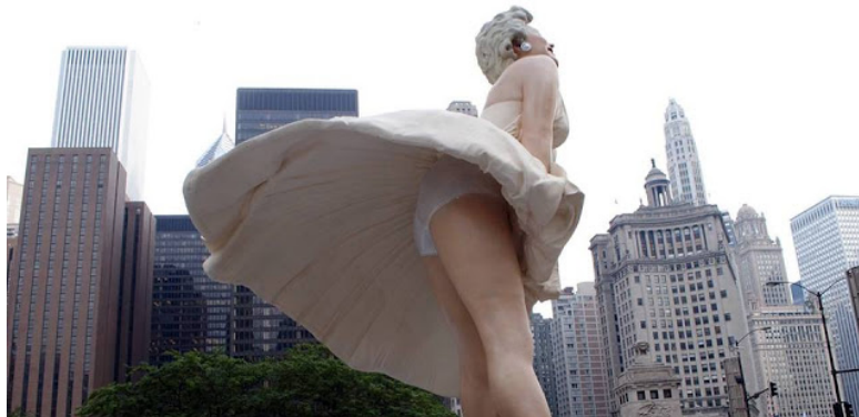
Agosto 2011: "FOREVER MARILYN" megascultura, Pioneer Court, 401 North Michigan Ave CHICAGO, ILLINOIS - IL 60611-4255