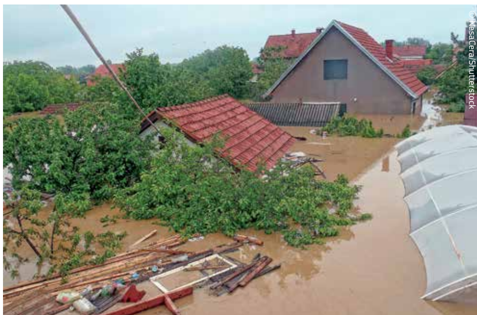
Il Fondo di solidarietà dell'UE fornisce un aiuto finanziario alle regioni europee colpite da gravi catastrofi naturali.

Un altro importante fondo gestito dalla Commissione europea è il Fondo di solidarietà dell'UE (FSUE), inizialmente istituito nel 2002 in risposta alle gravi inondazioni nell'Europa centrale. Il FSUE è ormai un fondo stabile con un bilancio annuale di 500 milioni di euro. È un'espressione della solidarietà europea nei confronti delle regioni colpite da catastrofi. L'UE può così rispondere in maniera rapida, efficace e flessibile per aiutare qualsiasi paese membro (o i paesi candidati all'adesione) in caso di gravi calamità naturali che hanno profonde ripercussioni sulle condizioni di vita, l'ambiente o l'economia. Il Fondo integra gli sforzi dell'amministrazione pubblica nazionale contribuendo, per esempio, a operazioni di bonifica, ripristino delle infrastrutture o allestimento di alloggi provvisori.