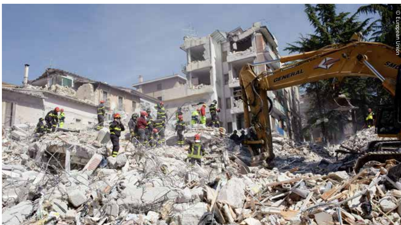
Nel 2012 l'Italia ha ricevuto 670 milioni di euro dal Fondo di solidarietà dopo i terremoti che hanno colpito l'Emilia-Romagna.

La maggior parte dei finanziamenti è servita a coprire i costi degli aiuti di emergenza e delle operazioni di salvataggio, nonché a fornire alloggi temporanei. Circa 292 milioni di euro sono stati stanziati per l'immediato ripristino delle strutture scolastiche e sanitarie e per riparare i sistemi dell'elettricità e dell'acqua.