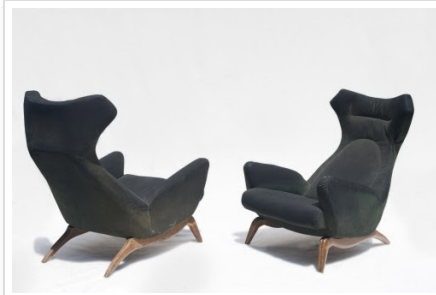
Carlo Scarpa, poltrona Club