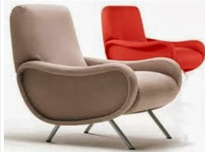
Marco Zanuso, poltroncina Lady , Arflex 1951