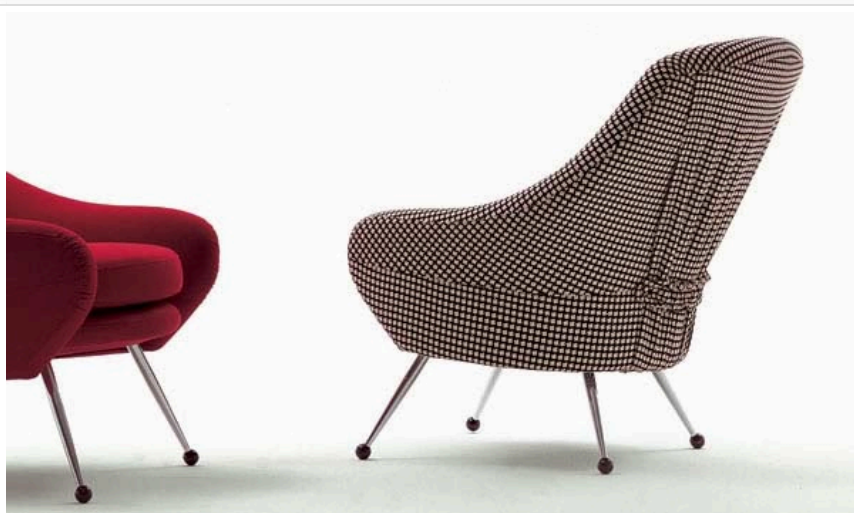
Marco Zanuso, Martingala Chair , Arflex, 1954