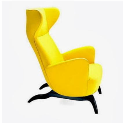
Carlo Mollino, poltrone per Casa Minola, Torino, 1944, Ardea , produz. Zanotta, 1992