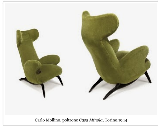
Carlo Mollino, poltrone Casa Minola, Torino, 1944