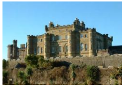
CASTELLO DI CULZEAN

La nona edizione di “English runs in Europe” si svolgerà presso la Saint Andrews University (nei pressi di Edimburgo), la più antica ed importante università scozzese, tra le più note e prestigiose di tutto il Regno Unito (nota anche perché vi ha condotto gli studi universitari il principe William e la consorte Kate), ove si terranno corsi intensivi di lingua inglese, nell'arco di due settimane (dal 21 luglio 2013 al 4 agosto 2013).